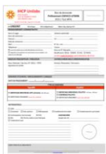
Fiche de demande