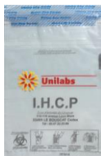
Sachet de transport